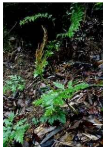
フユノハナワラビ