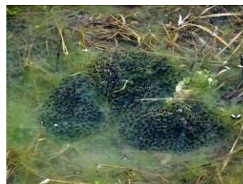
ニホンアカガエルの卵塊