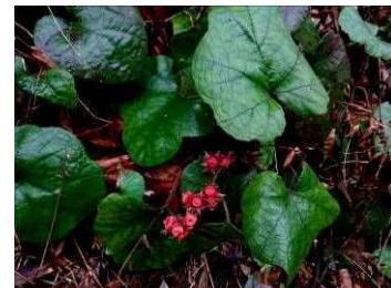
果実が落ちたフユイチゴ