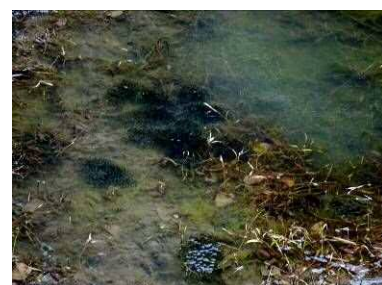
ニホンアカガエルの卵塊