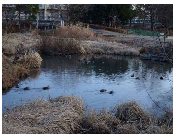
修景池のカルガモの群（6：48）