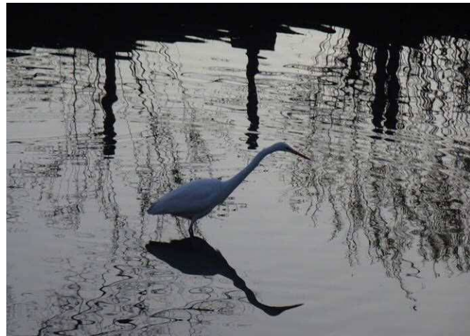
修景池のダイサギ