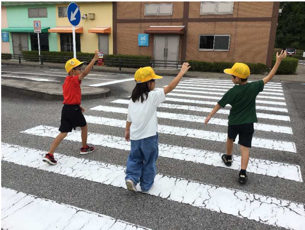
「交通安全教室の様子」