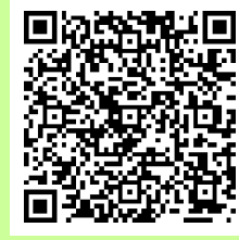
愛知県のポータルサイト