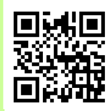
ツーリズムとよた