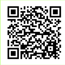
豊田市ホームページ