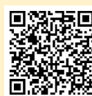
「ラーケーションの日」活動例