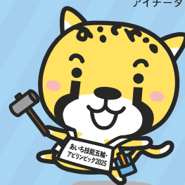
大会イメージ キャラクター アイチータ