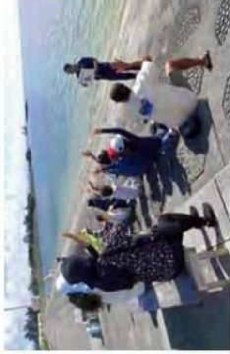
安全教室における海難事故防止に係る講習