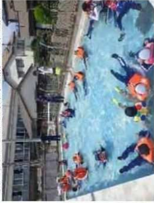
安全教室における海難事故防止に係る講習