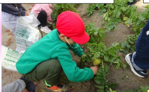
とても大きく育ちました。収穫も大変です。