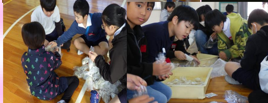
袋詰めされた餅を、5年生児童が一つ一つ丁寧にパッケージングします