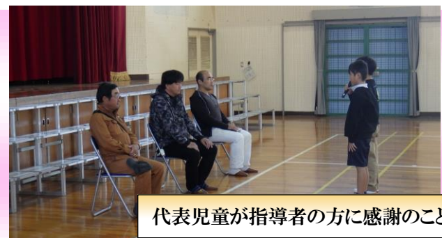
代表児童が指導者の方に感謝の気持ちを伝え、記念の品を渡しました