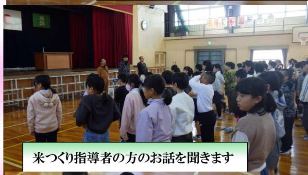
米づくり指導者の方のお話を聞きます