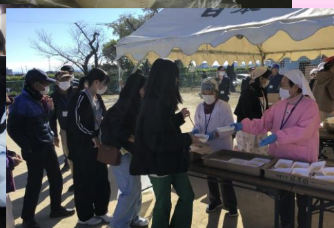
たかねまつりで地域の方にもふるまい

「七つ輪にふく風」は高嶺小学校のホームページ上で発行される学校だよりです。これからも随時、写真を用いて学校の様子をお知らせします。