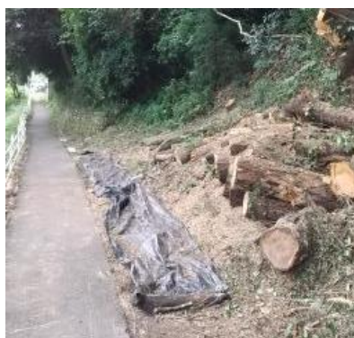
【大原口付近 木の伐採】