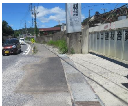
【国道沿い歩道の整備】