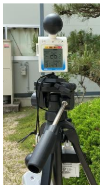
【玄関前設置熱中症指数計】