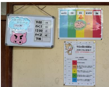
【保健室前暑さ指数掲示（子ども用）】

WBGT値31以上は、危険となり運動は原則中止 です。よって、 休み時間の外遊びや外清掃を中止 します。また、 下校時刻のWBGT値が31を超えることが予想される時は、教員による引率下校や保護者様によるお迎え下校 とします。 下校方法の変更（お迎えの依頼等）は、当日の昼頃に絆ネットメールにてお知らせ します。気象状況によっては、連日のお迎えとなる場合もありますが、子どもたちの安全を最優先に、ご協力よろしくお願ひします。なお、急なお願ひになりますので、ご家庭での対応が難しい場合は、学校へ連絡をいただければと思います。また、お迎えに来ていただける方の体調等により、校門坂下および則定集会所駐車場でのお子様の引き渡しを希望されるご家庭についても、その旨、ご連絡ください。