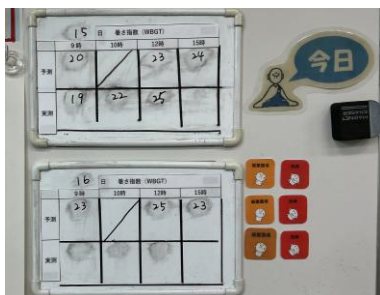
【職員室暑さ指数掲示（職員用）】