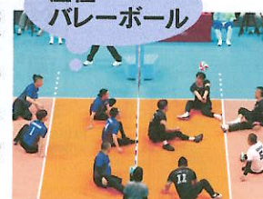
座位バレーボール