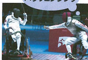
パラフェンシング