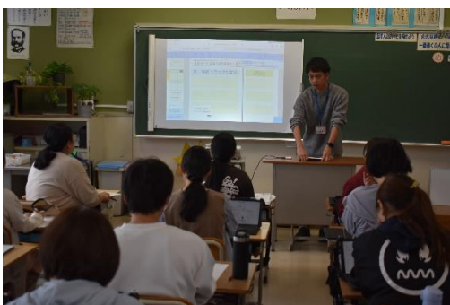
【授業に活用できるアプリの紹介】

私たち教職員は、教師力の向上を目指して、校内・校外において研修を積み重ねています。年度初めには、子どもたちの安全を守るための救急対応訓練等を行いました。4月下旬には、ICTの活用の仕方やユニバーサルデザインについて学び合いました。研修したことが目の前の子どもたちに還元できるように努めています。