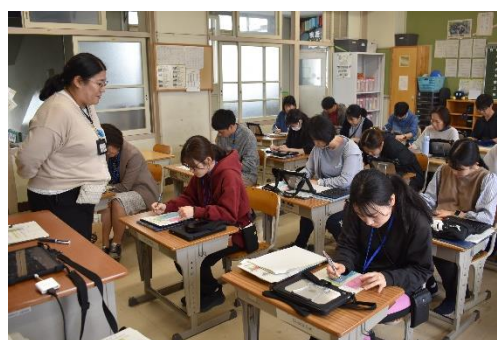
【4月の授業づくりについて自己採点】