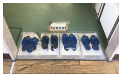
【2年男子トイレのスリッパ】

12月に入ってから校務支援員さんに各階のトイレ掃除をお願いしました。毎日子どもたちが清掃時間にトイレ掃除は行っていますが、子どもたちの手では十分にきれいにすることができません。特に、汚れが蓄積していたりほこりがたまっていたりする箇所を重点的に掃除していただきました。掃除前と後ではその違いがはっきり分かります。校務支援員さんの活動の様子は担任から子どもたちにも伝えました。これからは、「きれい」を持続することが大切です。教員の意識を強化することや子どもたちへの清掃指導を丁寧に行うことで、清潔感のあるトイレ&スリッパが揃っているトイレにしていきたいです。