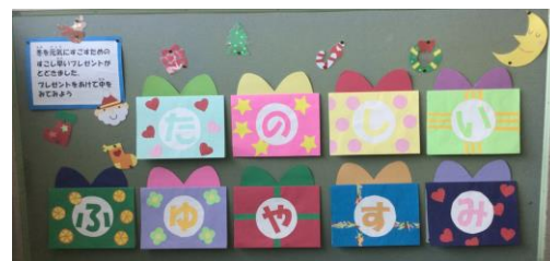
【保健室からもプレゼント】