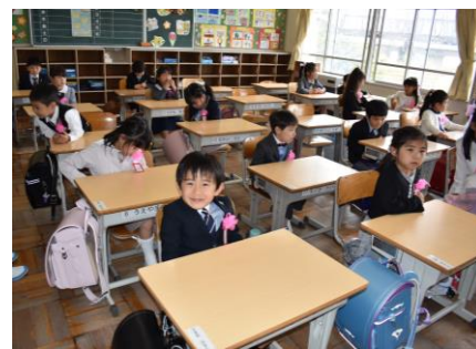
わくわく ときどきがいっぱい