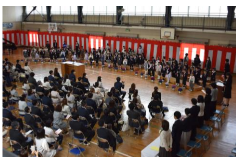
入学おめでとうございます