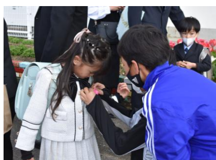
優しくて頼もしい6年生

4月4日(木)、多くのご来賓や保護者の見守る中、入学式・始業式を行いました。新1年生は、担任の先生に名前を呼ばれ、元気に「はい」と返事をすることができました。2年生から6年生は、教室からオンラインで参加しました。子供たちは希望をもってすてきなスタートを切ることができました。