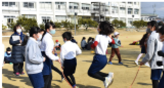
【なわとび大会(8の字跳び)の様子】