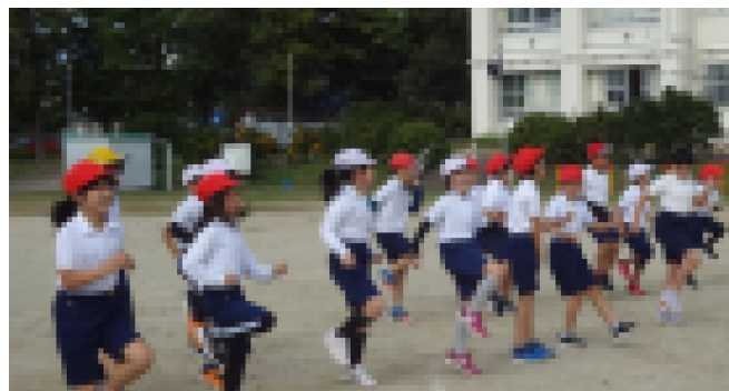
【走り方教室の様子】