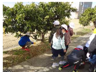
3・4年 根元に丁寧に肥料