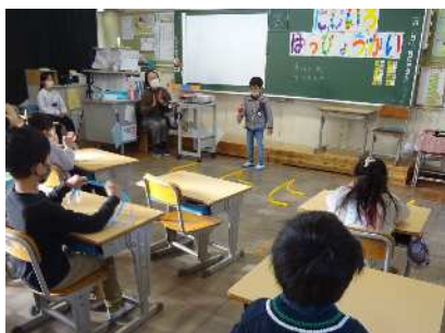
1年「できるようになったよ」

2月8日（水）に1・3・5年、2月10日（金）に2・4・6年が学習発表会を行いました。学習の成果をタブレットでのプレゼン、ポスターや新聞にまとめ、発表しました。当日は多数の保護者の皆様にご参観いただき、ありがとうございました。