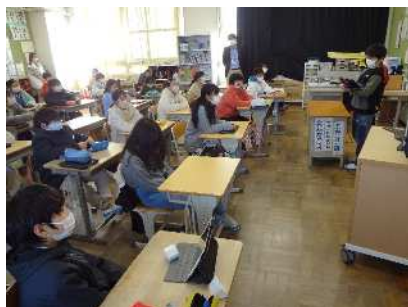
5年「プロジェクトK」 ～みかんの魅力を伝えよう～