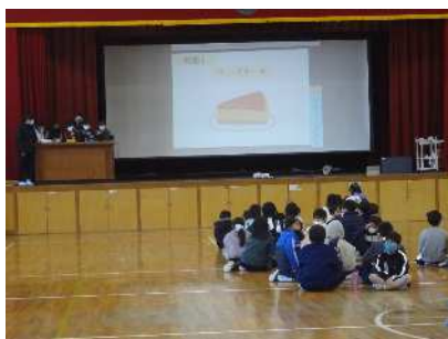
2・5年 お題はチーズケーキ