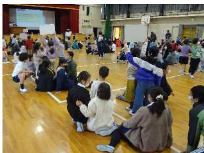
1・6年 班で問題に答える