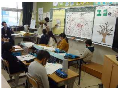
4年「広げようエコ輪プロジェクト」