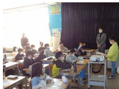
3年「わくわく😊キッズ」