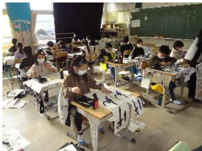
3年 初めての毛筆書初め