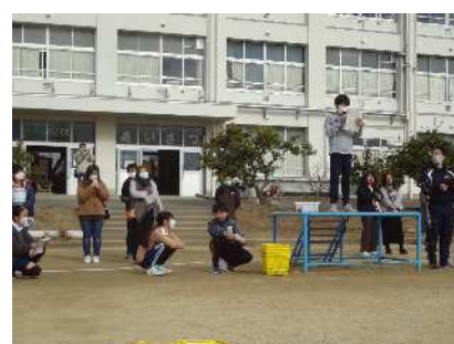
閉会式「結果発表です」