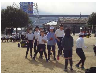
5年 笑顔で楽しく真剣に