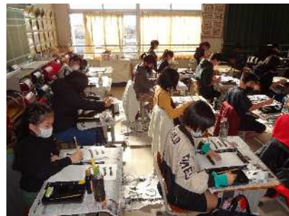
6年 小学校最後の大会