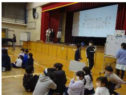
2・5年 問題を出します