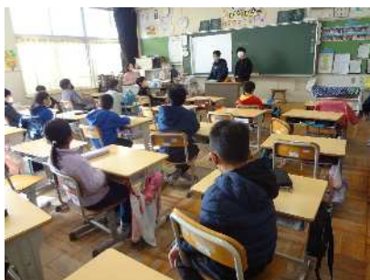
班長が司会で話し合い