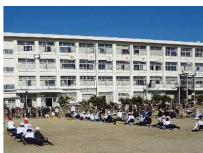
青空のもとで準備運動

令和5年の干支のウサギのように、子どもたちはぴよんぴよん飛び跳ね、練習の成果を発揮しました。クラスの友達と励ましの言葉をかけ合いながら、協力して頑張りました。