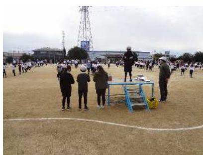
開会式「頑張りました」