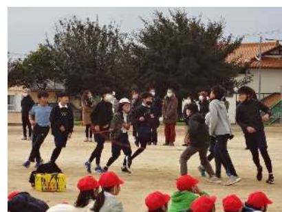
6年 流れるように滑らかに