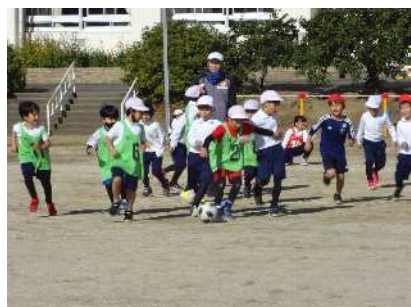
1・2年 楽しくサッカー