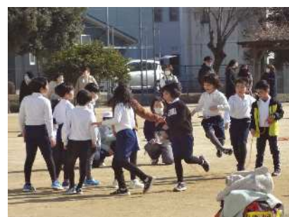
3年 リズムよくとぶ