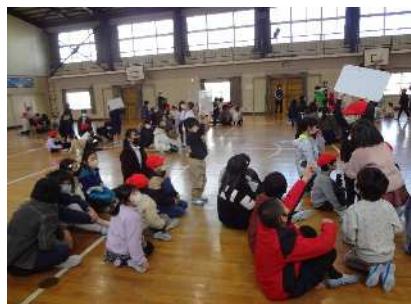
1・6年 答えを示します