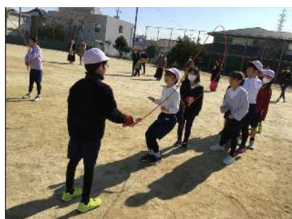
4年 みんなで心を一つに