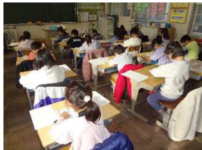
1・2年は硬筆 姿勢よく

1月10日(火) 新春恒例の書初め大会を行いました。1・2年生は硬筆、3～6年生は毛筆でそれぞれの課題に取り組みました。授業での書写や冬休みの課題として練習に取り組んできており、どの子の作品も力作でした。