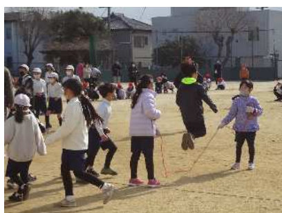
2年 縄回しも自分たちで