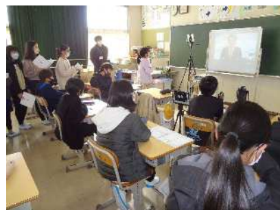
5年 自分の夢を発表する