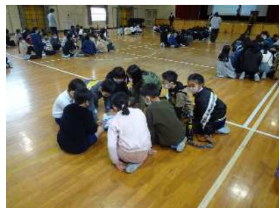
3・4年 一緒に考えよう