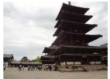
法隆寺の五重塔の内部見学

2日間の日程の中で、時間をしっかり守り、予定通りに活動することができました。また、班の友達どうし、協力して楽しく過ごし、楽しい思い出を作ることができました。