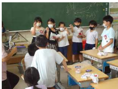
だんごが光っているよ