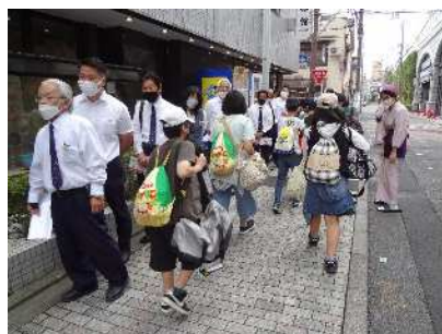
タクシー研修に出発