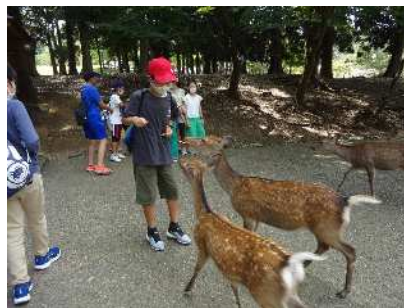
シカにせんべいをあげます