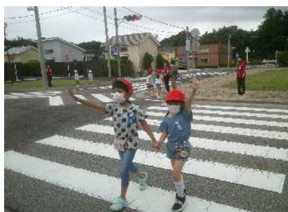
手を上げて横断します