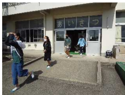
放課中、各自で避難