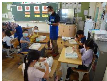
サポーターさんに教えてもらう