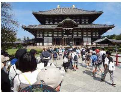
奈良の大仏を見に行きます