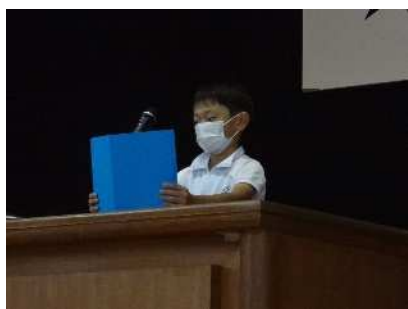
頑張った3つのこと

10月7日（金）に前期の終業式を行いました。2・4・6年の代表児童のスピーチがありました。3人とも前期に頑張ったことや努力したことを振り返り、後期の目標を力強く話すことができ、すばらしいスピーチができました。10月11日（火）から後期のスタートです。