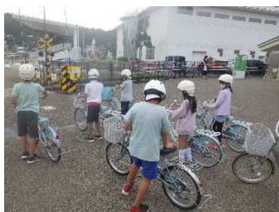
自転車の安全な乗り方を学ぶ