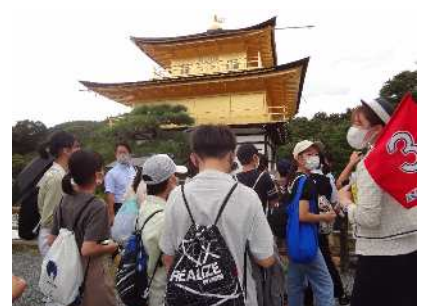
金閣の説明を聞きます