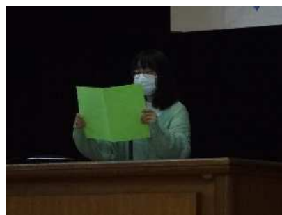
最高学年の自覚をもって