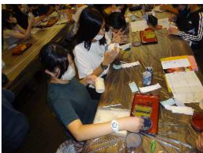
清水焼の絵付け体験