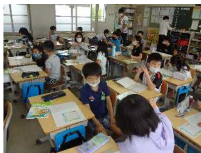
近くの子と意見交換