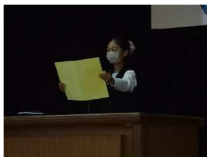
学級代表にチャレンジ