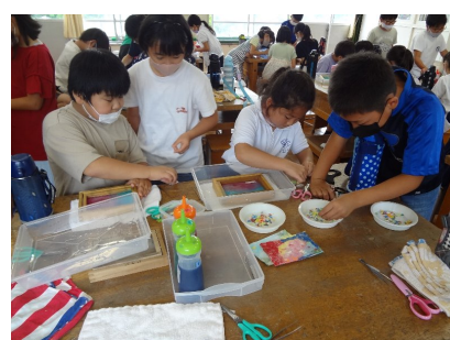
名前や飾りをつける