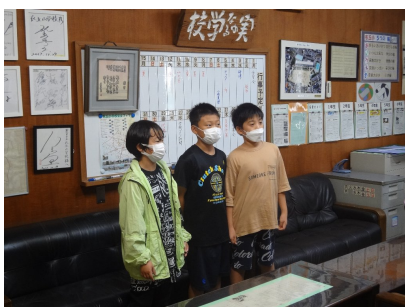
生活安全委員からの連絡