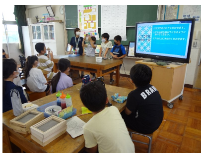
道慈小の子の説明を聞く