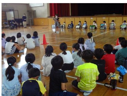
出会いの会であいさつを聞く

道慈小学校の子どもたちが、小原地区の伝統工芸である紙すきの方法を説明してくれました。衣丘の子どもたちは、和紙を作る工程を学び、色や模様をつけ、思い思いの作品に仕上げました。