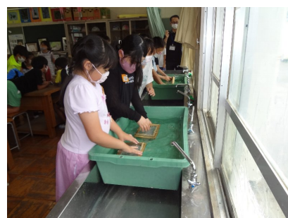
木の枠(スコテ)を洗う