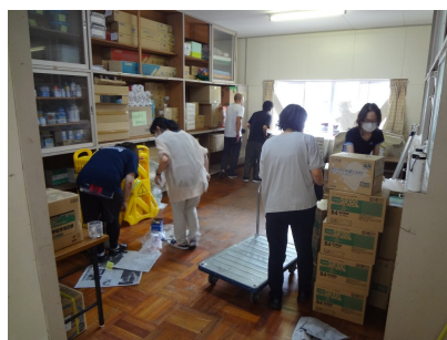
特別教室の備品整理