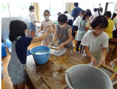
コウゾを木枠に入れる