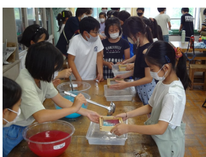
色付きパルプを入れる