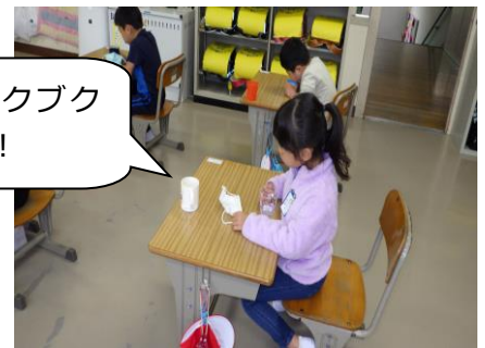
【1年生初めてのフッ化物洗口】