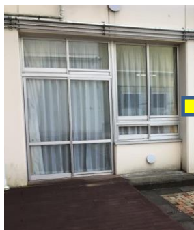
ウッドデッキ側出入口