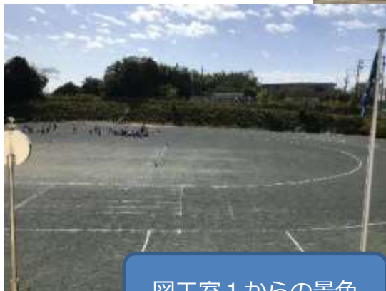
図工室1からの景色