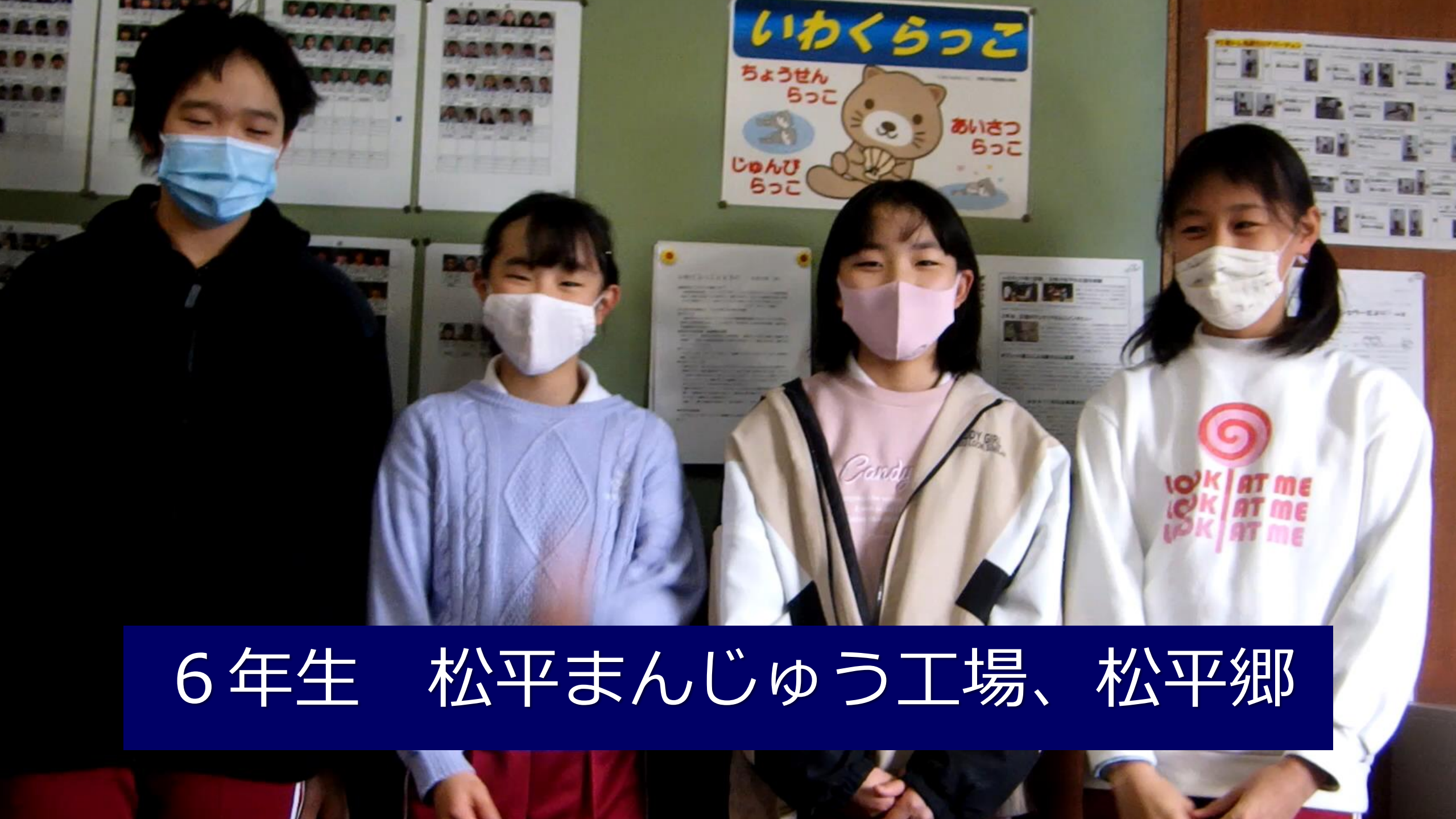
6年生 松平まんじゅう工場、松平郷