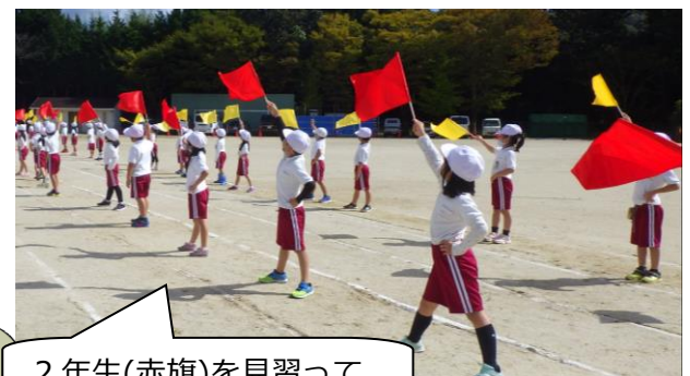
2年生(赤旗)を見習って。