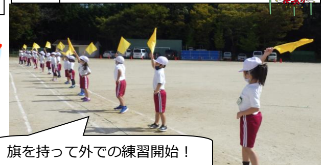
旗を持って外での練習開始！