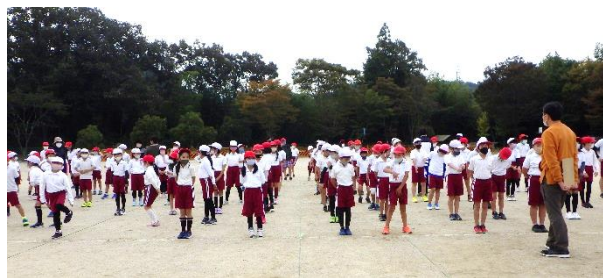
開閉会式全校練習（10月21日）

いよいよ今週土曜日が運動会です。表現運動は各学年が趣向を凝らした小物、衣装で盛り上げます。