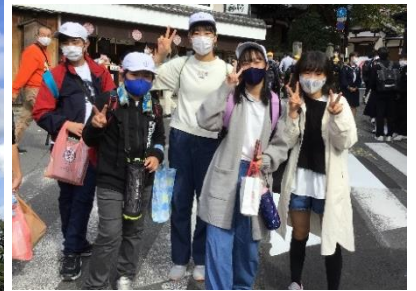
清水坂・班別で買い物