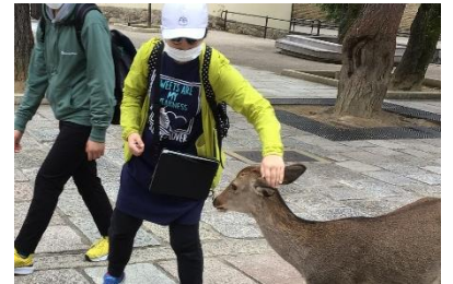
奈良公園・鹿とのふれあい

10月18日(月) 学校集合7:00、発7:30→三十三間堂→清水寺(昼食・買い物)→二条城→金閣寺→京都タワー→旅館(京都)