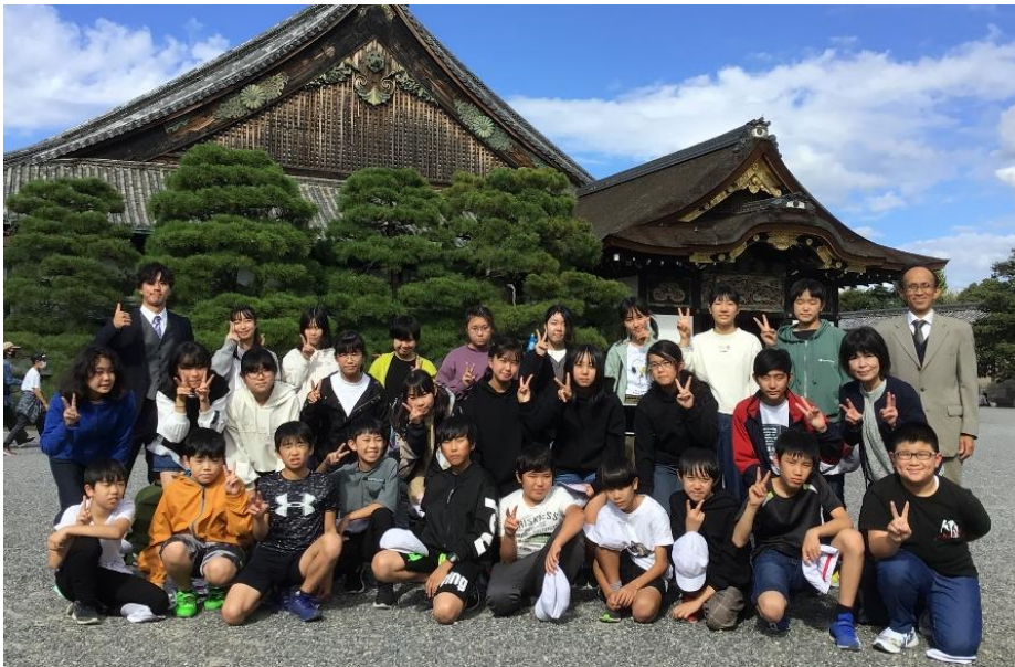
10月18日 京都・二条城にて