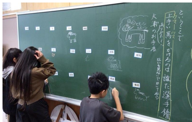
【5 年生 上手い馬をかけるのは誰だ選手権】