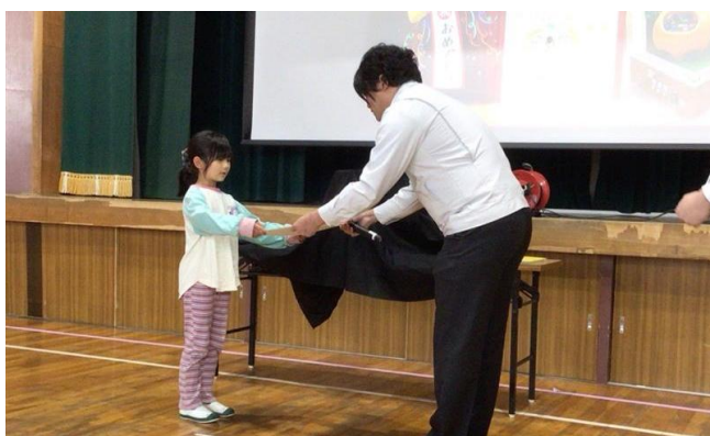
【トヨタ自動車社員の方から賞状を受け取る1年生】

続いて、トヨタ自動車株式会社が主催した「こども乗りものデザイン展」で優秀賞を獲得した1年生の表彰式が行われました。1年生がデザインした車「だいすきみかんごう」が実物となり贈呈されました。実際にラジコンで走行して、みかんジュースが出てくる蛇口が電飾で光りました。8,300作品の応募の中から優秀賞は11作品です。飯野小は2年連続で受賞となりました。