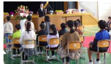
在校生の座席を前に移動させました