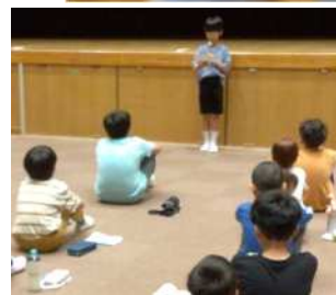
写真の詳細はホームページをご覧ください