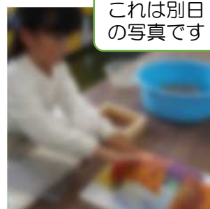
これは別日の写真です

1年生は前回に引き続き「おもしろいかお」の仕上げを、2年生は「カラフルぼうし」の下地づくりを行いました。子どもたちは、道具などの準備や色の混ぜ方、紙の漉き方など、手際よく行うことができていました。作品の完成が楽しみです。