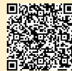
「ラーケーションの日」ポータルサイト

※ 県の Web ページ「ラーケーションの日」ポータルサイトには、計画づくりに活用できる「ラーケーションカード」や、いろいろな学びができる場所を紹介しています。参考にしてください。