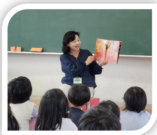
朝・昼の読み聞かせ