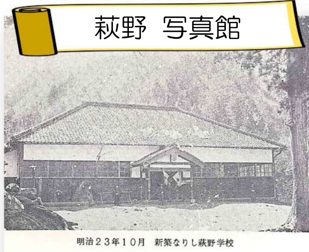
明治23年10月 新築なりし萩野学校