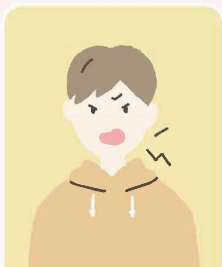
怒りやすくなった