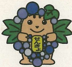
【愛知県東浦町】 きよほうめいすいくん