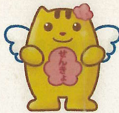
【東京都青梅市】 おうめいすいくん