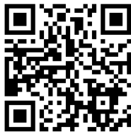
QR とよた i マップ