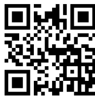
ツーリズムとよた