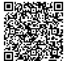
愛知県のポータルサイト