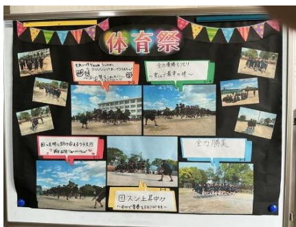
【3年生 学年黒板より】

5月13日(水)は体育祭です。いよいよ来週に迫った体育祭に向けて、学年や学校全体での練習が、次第に熱を帯びてきました。