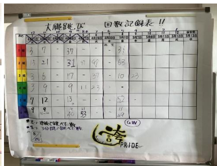
【1年生 学年黒板より】