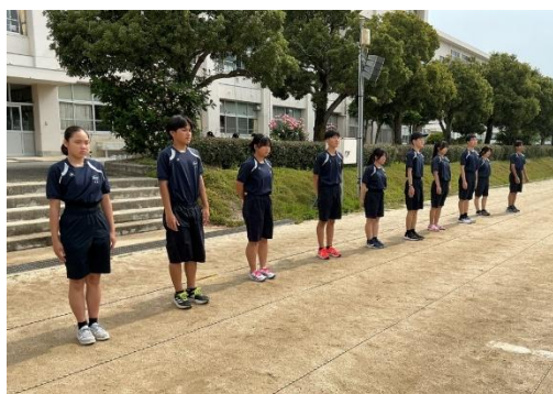
【体育祭実行委員のみなさん】

生徒も先生も体育祭を通した学級作り、学年作りに励んでいることが伝わってきます。5月8日(金)の全校練習では、真剣に丁寧に練習に取り組む生徒がたくさんいました。週間天気予報では、天気心配はなさそうです。当日の生徒の活躍が楽しみです。