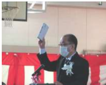
式辞「最後の校長授業」