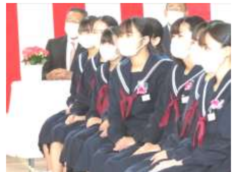
身体を向けて話を聞く女子生徒