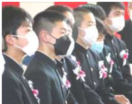
話を目で聞く男子生徒