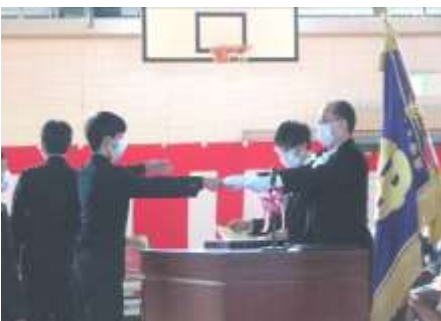
卒業生一人一人への証書授与