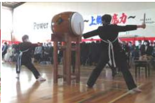
活躍する在校生 <太鼓と校旗登壇>