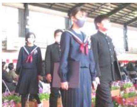
大きな拍手に送られ退場する卒業生