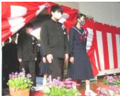
厳かな卒業生入場