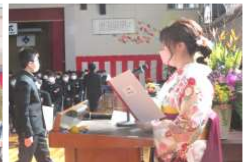
担任による心のこもった呼名