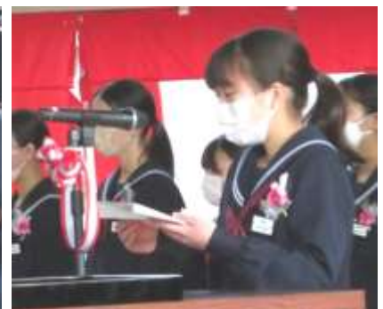
涙をこらえて答辞を読む代表