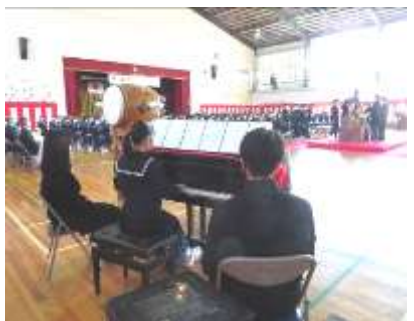
活躍する在校生<ピアノ伴奏>