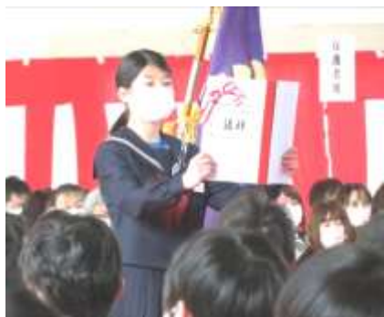
在校生からの送る言葉