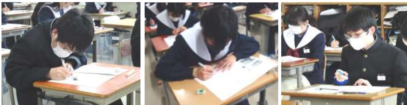
真剣に学年末テストに取り組む生徒たちの様子です(2月10日、15日撮影)

来年度は、2月15日（水）～17日（金）に、3学年とも実施する予定（3年生は2日間5教科のみ）です。公立高校の入試日程が早まるため、市全体で同じような形式になりました。