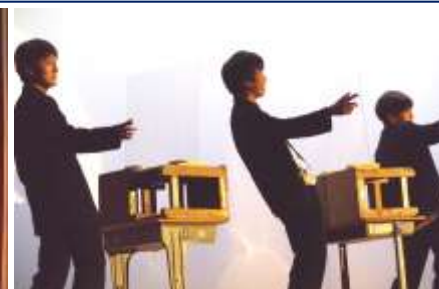
3年生有志によるコント