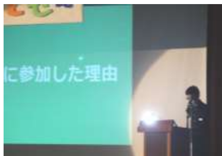
国際理解推進セミナーの報告

今回初めて、リモートでの開催を試みました。音声などの面で十分な内容と言えない部分もありました。反省を生かし、今後の改善を心がけます。