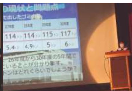
SDGs学習 1年生代表の発表