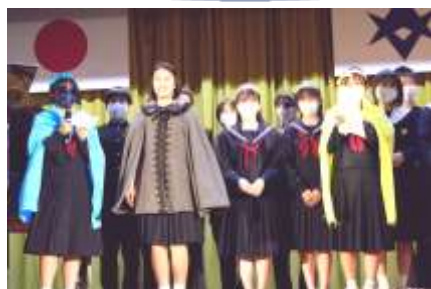
オープニングの様子

まだまだ多くの写真があります。次号の学校だよりでも、体育祭と文化祭の写真を掲載させていただきます。