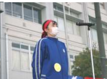
閉会式 生徒代表の話(2年生)