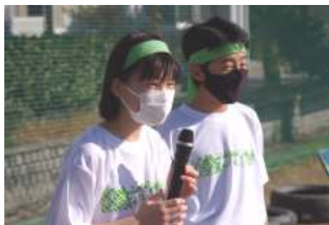
生徒による実況放送(1年生)