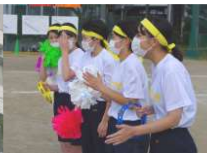
仲間への熱い応援(3年生)