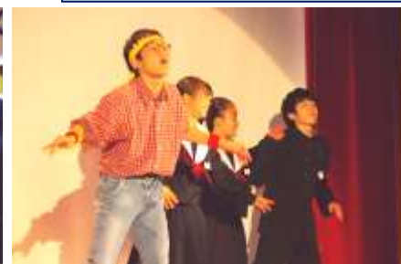
2年生有志によるダンス