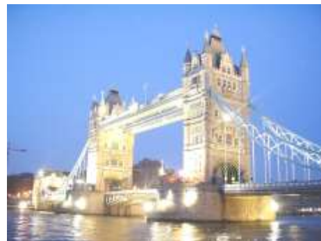
ロンドンの名所「タワーブリッジ」

今年度は、その代替事業として、「豊田を知り、世界を知ろう！国際理解推進セミナー ～タブレットを活用し、世界とつながる。豊田市の魅力を発信しよう～」が実施されることになりました。