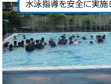
水泳指導を安全に実施しました。