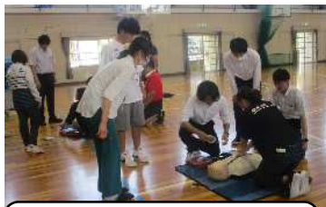
6月19日応急手当講習 職員で救急の講習を。