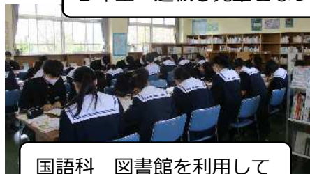
国語科 図書館を利用して