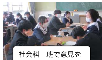
社会科 班で意見を