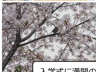
入学式に満開の桜

中学生になると、これまでの生活とは大きく変わることがあると思います。これから始まる中学校生活を前に大きな期待でわくわくするという反面、不安もたくさんあります。しかし、先生方、先輩方に教えていただいたり、一緒に入学した仲間と共に、励まし合ったりすることで、不安を乗り越え成長していきたいです。私たち新入生151名は校訓である「切磋琢磨」を胸に勉強、運動、部活動、行事を、仲間と共に、磨き合い、励まし合い、鍛え合うことで、いきいきと学び、さわやかに、ともにのびゆく井郷中生になれるように、努力することを誓います。（代表 誓いの言葉）