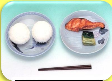
おにぎり 塩鮭 菜の漬物

にっぽん はじ がっこうきゅうしょく 日本で初めての学校給食が はじ 始まりました。