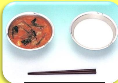
トマトシチュー ミルク