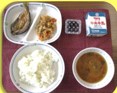
ごはん 牛乳 あゆの一夜干し揚げ とよたチャンプルー きのこのみそ汁 ブルーベリーゼリー