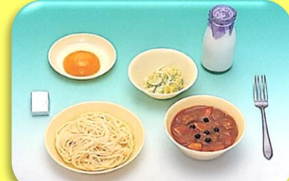
ソフトめんのカレーあんかけ 牛乳 甘酢あえ くだもの(黄桃) チーズ

ソフトめんが 出されるよう になりました。 ミルク(脱脂粉乳)に代わって牛乳が 出されるようになりました。