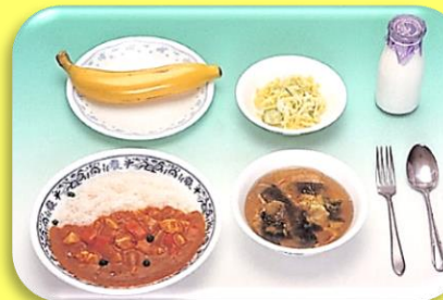
カレーライス 牛乳 スープ 塩もみキャベツ くだもの(バナナ)