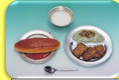
コッペパン ミルク 鯨肉の竜田揚げ せんキャベツ ジャム

がいこく せんご がっこうきゅうしょく はじ 外国から送られてきた小麦粉で作った パンが出されるようになりました。