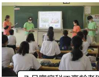
7月家庭科で高齢者疑似体験