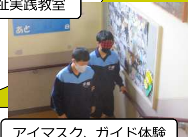
アイマスク、ガイド体験