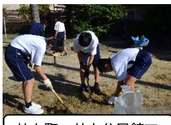
井上町 井上公民館で