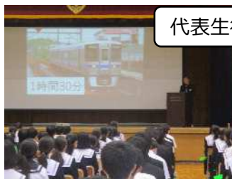
代表生徒が発表しました。

6月14日～16日に2年生が職場体験をしました。総合的な学習の時間などを使って、自分が職場体験で学んだことをまとめました。働くことに何が必要か、どんなことを感じたのか、自分の将来のために考えたことなど、2年生は、自分たちの将来、働くことの意味を見つめることができました。そして、これから職場体験をする1年生に向けたメッセージなどを伝える時間となりました。