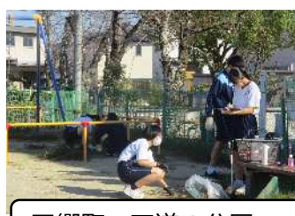
四郷町 天道の公園で