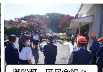
御船町 区民会館で