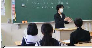
4月25日 マナー講座(2年生)

2年生は6月14日～職場体験です。 マナーや身なりが、なぜ必要なのか、 講師の方の説明がとても分かりやすく 伝わってきました。職場で実践します。