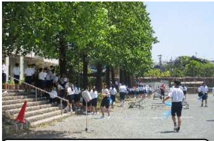
練習の合間に日陰で水分補給