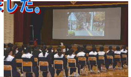
4月25日 自転車講習会(1年生)

2年生は6月14日～職場体験です。 マナーや身なりが、なぜ必要なのか、 講師の方の説明がとても分かりやすく 伝わってきました。職場で実践します。