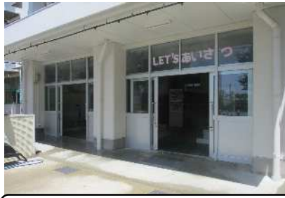
昇降口のみストを始めました