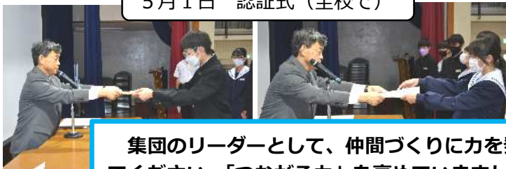
5月1日 認証式(全校で)

集団のリーダーとして、仲間づくりに力を発揮し てください。「つながる力」を高めていきましょう。