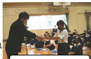
イエローリボン贈呈

その後の部活動紹介では、各部が特徴のある紹介をし、最後に1年生にイエローリボンの贈呈があり、「思いやりのあふれた学校に」する仲間入りをしました。