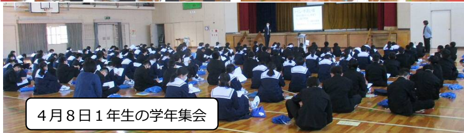
4月8日1年生の学年集会

4月8日は、学年集会で中学校生活のいろいろな話がありました。その中に「先手のあいさつ」があります。この2週間でも実行しようと取り組んでいます。