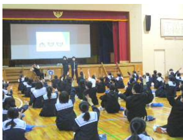
4月21日新入生歓迎会