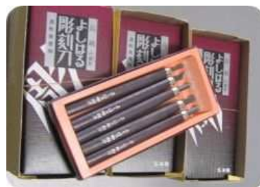
授業予備用 彫刻刀