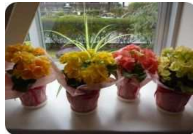
入学式・新入生教室用 花