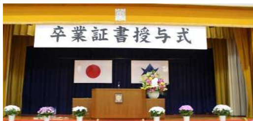
卒業式舞台用看板