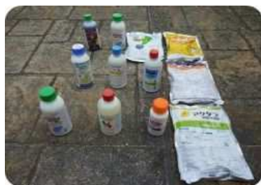
薔薇園整備用 農薬