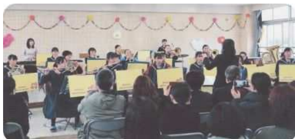
ブラスバンド部 大会出場支援