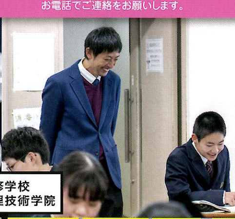
専修学校 東洋調理技術学院